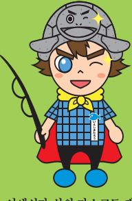
이예시마 섬의 마스코트 캐릭터 '이예시마 다로'

MY HOME ISLAND 영상 배포 중 https://www.youtube.com/user/ieshima00kankou